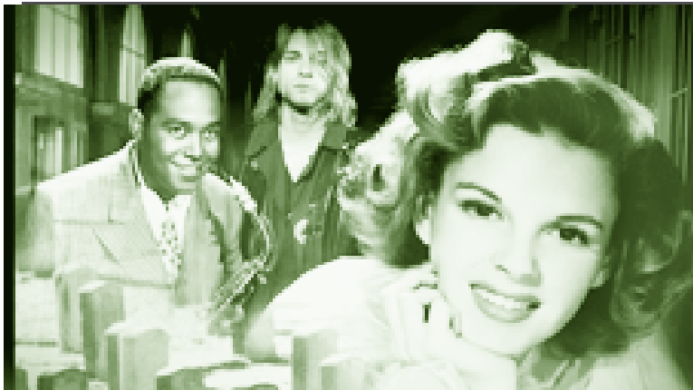
Charlie Parker, Kurt Cobain en Judy Garland allen slachtoffers van psychiatrie.

A n het einde van de 19de eeuw vonden er in Europa twee ontwikkelingen plaats, die de wijze waarop mensen naar zichzelf en de samenleving keken in grote mate zouden beïnvloeden. In 1879 verkondigde de Duitse professor in de psychologie Wilhelm Wundt in Leipzig met veel autoriteit, maar zonder enige wetenschappelijke grondslag, dat de mens niet meer was dan een zielloos dier, louter een product van zijn omgeving.