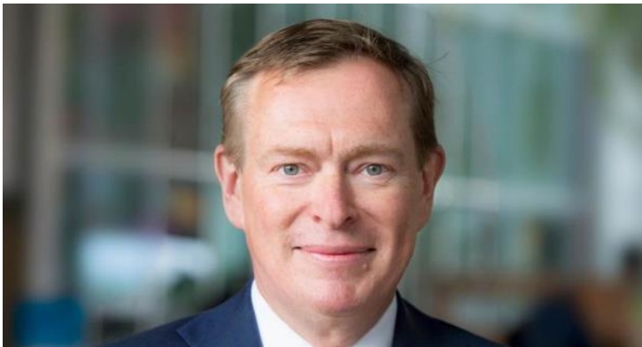
Minister Bruins, volksgezondheid, welzijn en sport

https://www.rijksoverheid.nl/regering/bewindspersonen/bruno-bruins/nieuws/2019/02/02/minister-bruno-bruins-wil-gebruik-zeer-zware-pijnstillers-terugdringen