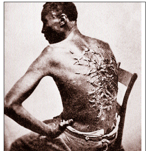
In 1851 "ontdekte" Samuel A. Cartwright een geestelijke ziekte die specifiek voorkwam bij zwarte slaven en die hij "Drapetomania" noemde — het was de drang van slaven om weg te lopen van hun "meesters". De voorgeschreven "behandeling" was de duivel uit ze te ranselen.

Met hun geschiedenis van verzonden racistische "ziekten", vooroordelen over "betere rassen" en belachelijke wetenschappelijke concepten zoals "lager IQ" en "raciale minderwaardigheid", hebben de psychiatrie en de psychologie niet alleen het racisme in de 19 e , 20 e en 21 e eeuw gerechtvaardigd, maar ook de aanzet gegeven tot regelrechte genocide.