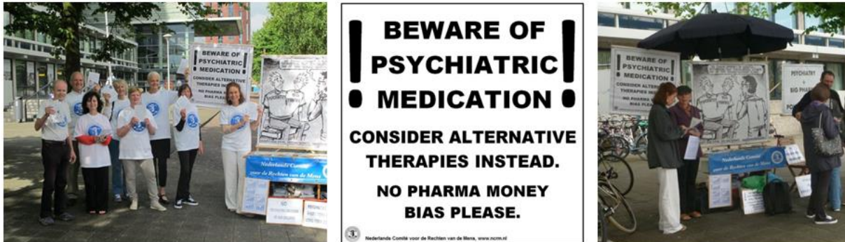
Demonstratie bij psychiatrie conferentie. Midden: spandoektekst voor deze gelegenheid. Buitenlandse deelnemers lieten zich trots voor het spandoek fotograferen.

Een aantal NCRM sympathisanten was present toen de inschrijfbalie van de conferentie opende. We installeerden ons pal voor de ingang, wat nogal aandacht trok.