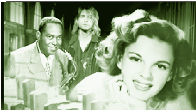
Charlie Parker, Kurt Cobain en Judy Garland allen slachtoffers van psychiatrie.

A n het einde van de 19de eeuw vonden er in Europa twee ontwikkelingen plaats, die de wijze waarop mensen naar zichzelf en de samenleving keken in grote mate zouden beïnvloeden. In 1879 verkondigde de Duitse professor in de psychologie Wilhelm Wundt in Leipzig met veel autoriteit, maar zonder enige wetenschappelijke grondslag, dat de mens niet meer was dan een zielloos dier, louter een product van zijn omgeving.