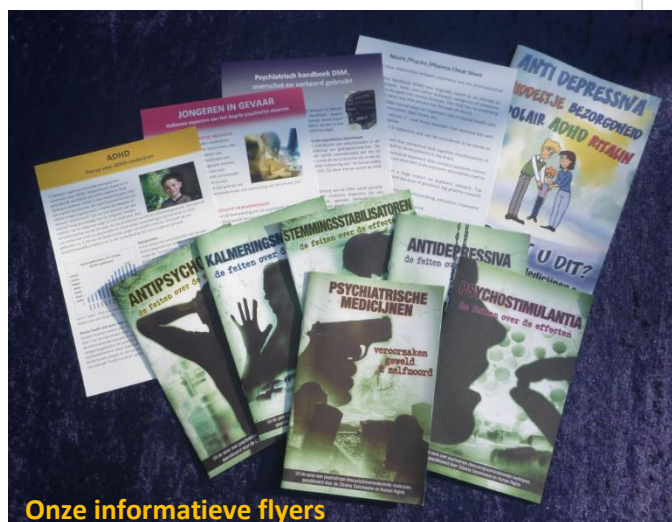
Onze informatieve flyers

http://www.ncrm.nl/wp-content/uploads/2017/08/Flyer-psycho-neuro-cheat-sheet-version-Aug-2017-NCRM.pdf