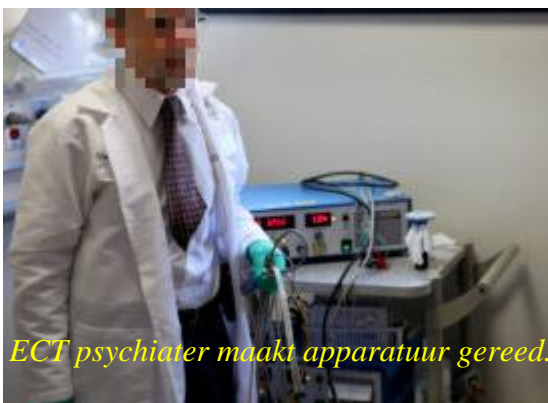
ECT psychiater maakt apparatuur gereed.

In februari jl. vroegen wij bij instellingen die ECT toepassen om gegevens over de omvang daarvan. Wij ontvingen geen reacties. Daarna vroegen wij aan de Minister van VWS om gegevens, die wij in mei jl. ontvingen per brief. ( link ) In het kort: volgens door het Ministerie gevonden gegevens werd in 2015 in de curatieve GGZ 14.858 keer ECT toegepast op 966 patiënten, waarvan 28 keer ECT onder dwang. Van ECT in de langdurige zorg zijn geen cijfers te achterhalen. ( link naar de Kamerbrief)