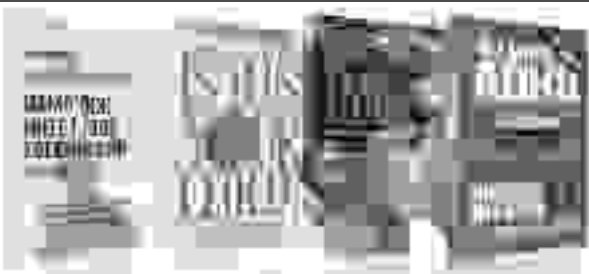
Numerous books show that health and educational problems alone can cause attention and behavioral problems, thereby discrediting the "ADHD" learning disorder monopoly.

Na het onderwijssysteem te hebben gefiltreerd en aldaar posities van macht en autoriteit te hebben verworven en de voorbereidingen te hebben getroffen voor een systematische aanval met psychiatrische diagnoses, gooide de psychiatrie haar volgende, meest gevaarlijke en meest winstgevende wapen in de strijd tegen onze jongeren verslavende en bewustzijnsveranderende middelen vermomd als medicijnen.